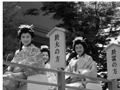
☆公募により選ばれた『於大の方』など華やかな女性列