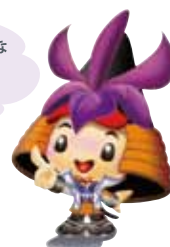
刈谷市マスコットキャラクターかつなりくん