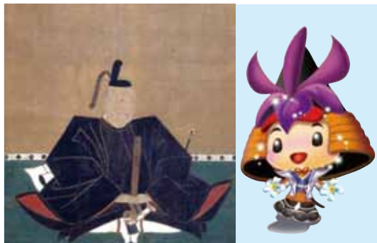
水野 勝成 肖像画

慶長3年（1598）3月、勝成は伏見城で徳川家康に謁見し、そのとりなしで忠重に對面して勘当を解かれます。勘当されたのが天正12年ですので、実に14年もの月日が経っていました。